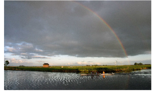
Dokkumer Ee bij Tergracht, met aan de overkant de plek waar vroeger de boerderij stond