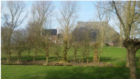
Wirdserterp nabij Wanswert