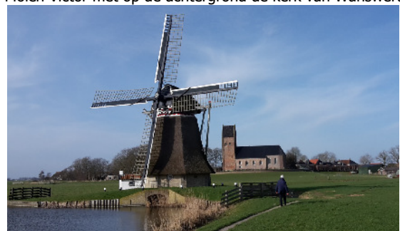
Molen Victor met op de achtergrond de kerk van Wanswert

C) Molen Victor bij Wanswert, achter de Pastorie Plaats, werd in 1867 gebouwd voor de bemaling van de polder Ald Piip , als vervanging van zes kleinere poldermolens en drie tjaskers. In 1975 werd de molen eigendom van de Stichting De Fryske Mole, die hem twee jaar later liet restaureren. De molen bemaalt de Wanswerderpolder. Victor werd in 2006 door het Wetterskip Fryslân aangewezen als reservegemaal in geval van wateroverlast. De molenaar zal ons uitleg geven over de historie en werking.